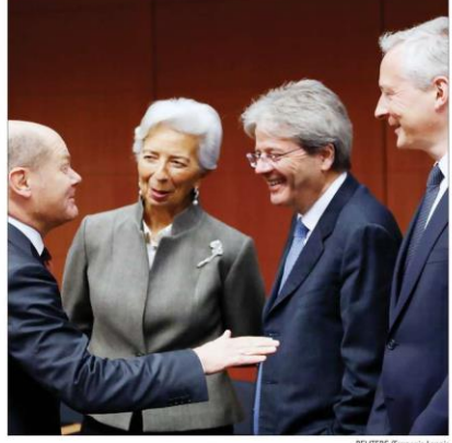
Menteri Keuangan Jerman Olaf Scholz (kiri), Presiden Bank Sentral Eropa Christine Lagarde (kedua kiri), Komisaris Ekonomi Eropa Paolo Gentiloni (kedua kanan) dan Menteri Ekonomi Prancis Bruno Le Maire berunding saat menghadiri pertemuan Menteri Keuangan Zona Euro yang berlangsung di Brussels, Belgia (17/2).